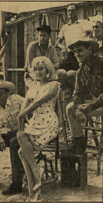
יוצאי-דופן ב'יוצאי דופן' * האושר ברח

יוצאי דופן (ירון — תל-אביב; ארצות-הברית) מוגש לקהל הצופים כמערבון עמוס כוכבים וגדוש פעילות פראית. הצופים שנתפתו לקבלו בתור שכזה, יוצאים מאוכז-בים. כי הסרט אינו אלא יצירה פילוסופית עמוקה, בה חברו יחד כישרונותיהם של ארתור ("ציד המכשפות") מילר — שזה לו תסריטו הראשון — והנבאי ג'ון ("המלכה האפריקאית") יוסטון.