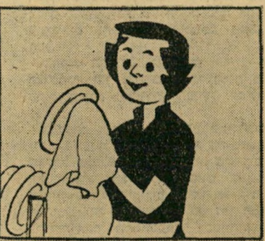
— או שזו מעמסה בלתי-נסבלת?