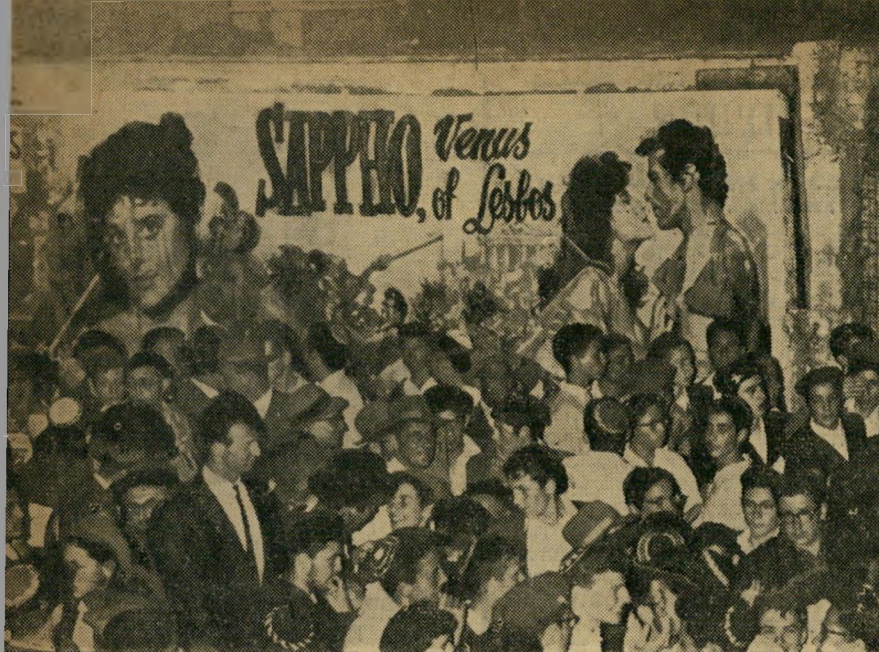
הפגנת הדתיים נגד הצגת פיטר פריי בצל הסביות

דוגמה אחת לתכתי העסקנים: שעה שהוציאו גלוי-דעת נגד ההתפרעויות במיגרשים, ביצעו מעשה של ליכוד יצרים שעשוי היה להביא לשפיכות-דמים. כאשר עמדה הכוח לשחק נגד הפועל קריית-חיים, היתה יריבתה למירוץ האליפות, הפועל טבריה, צריכה לשחק מישחק-גיבוי בביתה. הטבריינים בייקשו להעביר את מישחקם לקריית-חיים, כי