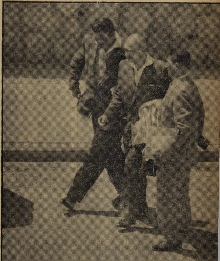
בר נעצר בערב פסח, ב־2 בנוקר, בביתו

פרשנים ומומחים צבאיים מארצות המערב שביקרו בישראל מצאו כבר מארח נעים, המוכן תמיד לשוחח על תוכניות־נאט"ו ולהחליף דעות על מערך כוחות־המערב. אמרי-