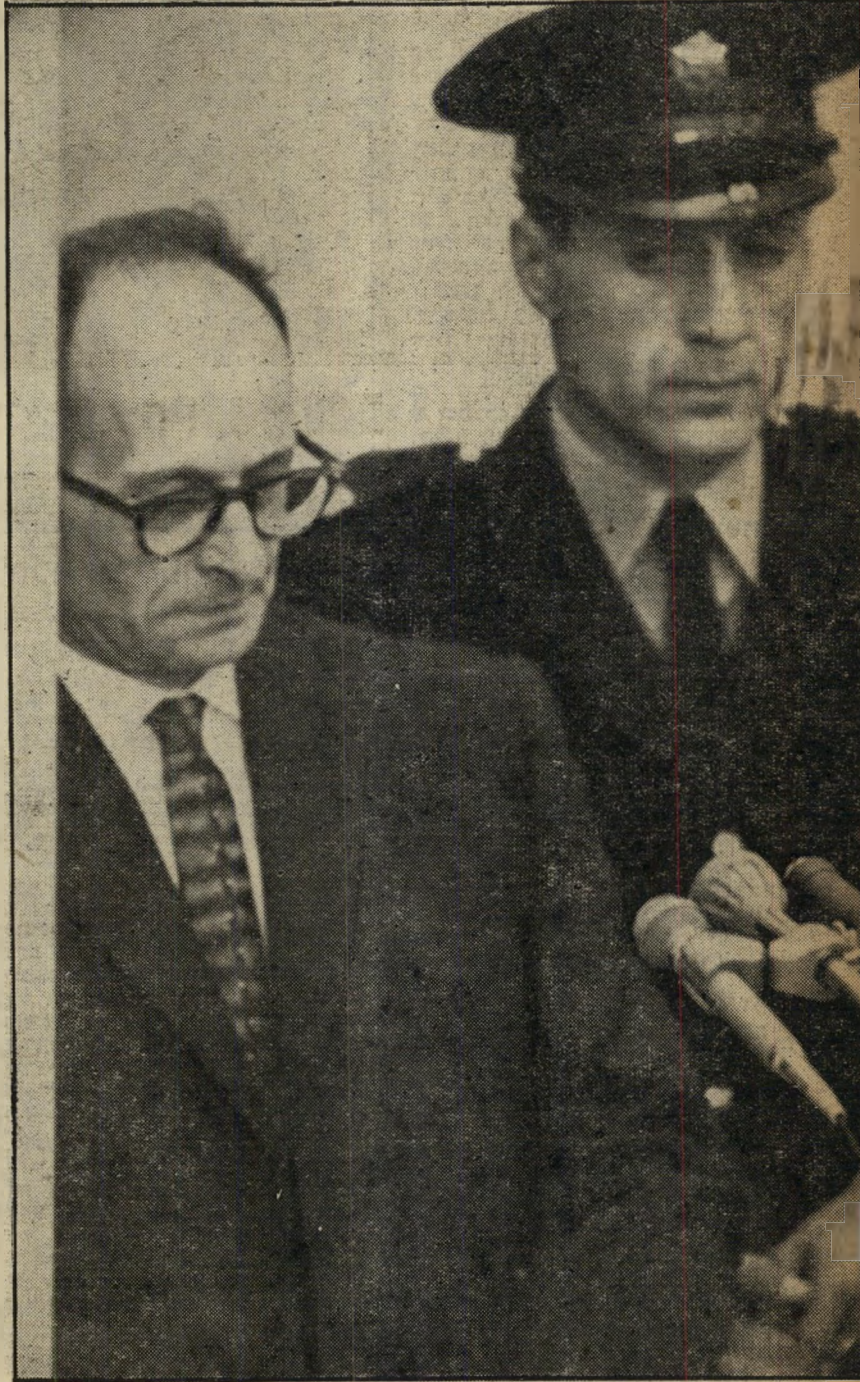
אדולף אייכמן עוקב אחרי התחלת הדיונים, מאחורי הזכוכית המשוריינת של תאו. ליצדו: אחד משני שומרי הצמודים. בתמונה זו ניכרת המתיחות על פניו — מתיחות שדרך כלל התאמץ שלא להראות.

איפה? מאחורי דלפק של באנק? כפקיד של דואר? כעורך לילה קשיש בעיתון יומי?