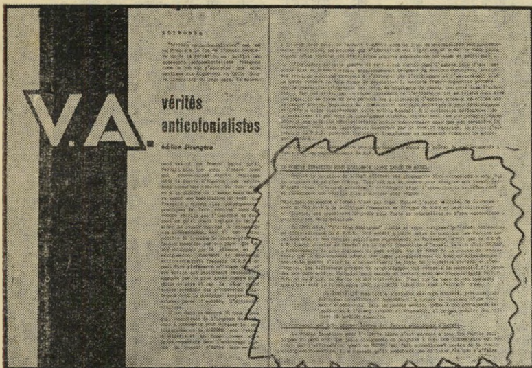
בטאון הפל"ן על הוועד הישראלי למען אלג'יריה החופשית קול מן המחותרת

„מאז ראשית המלחמה“, אויבי החעד הישראלי ניבאו כי הפל"ן יולול ב" יוזמה הישראלית, שהתגשמה רק עתה, אחרי