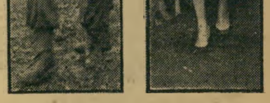
אופנת שרתון - אופנת הצעירה

אני מציעה שתפרסמו זו בצד זו את המונות הצועדות והנודנמיות, כל אחת בי