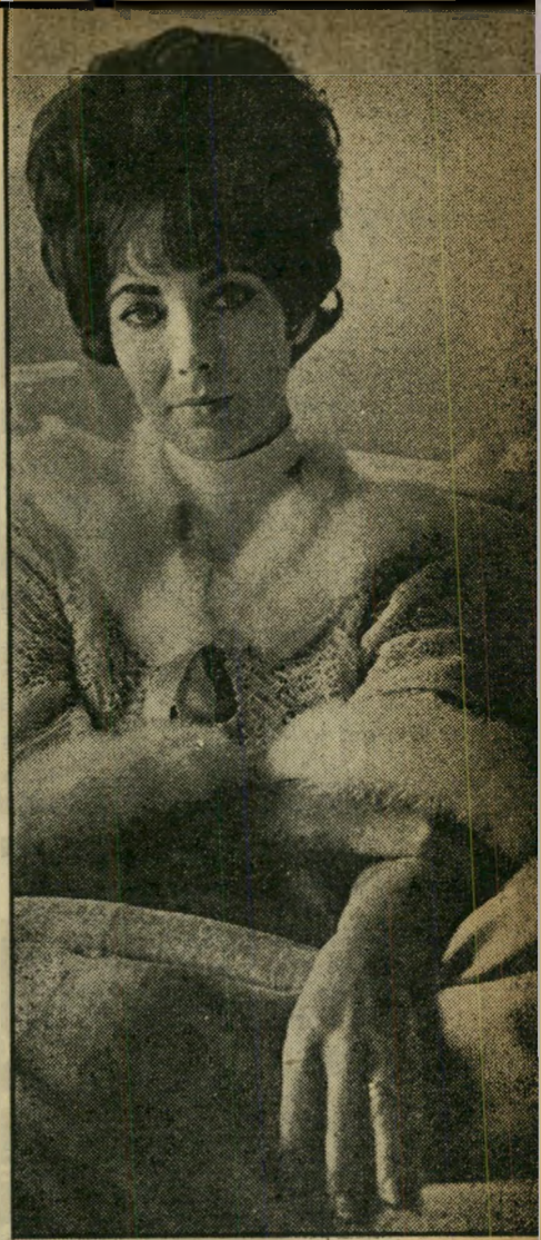
ליו במיטה מה מוסתר?