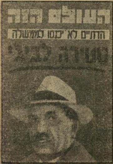
שער „העולם הזה“ 1222

„כששמעתי בראדיו כי הנהלת הדתיים-לאומיים החליטה שלא להצטרף, חשבתי מיד על העולם הזה. בחיי, אתם נביאיכו!“ אמר לי השבוע עסקן מפלגתי חשוב. חוששני כי אותו עסקן, וגם כמה מן הקוראים, עדיין אינם מבינים די צורכה את