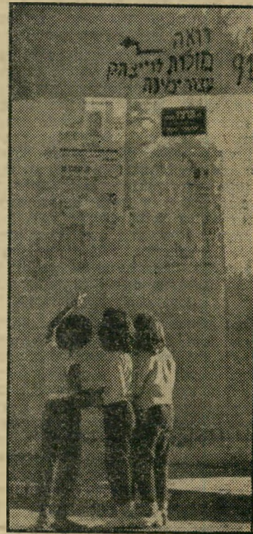
תמרור לעתיד מצויר על קיר בית ברחוב רצ"ז ביפו, המכוון את ה- תנועה לרואה המולות לוי יצחק (ה- ירושלמי). הקורא דויד יצחקי, תל- אבא, הציג את התמרור.