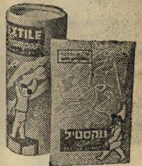
תוצרת "נקה" הספיצים היחידים: חברת נורית בע"מ

כמו כל עקרות הבית הנבונה, סמכי גם את על טקסטיל שמפו לכביסת כל האריגים העדינים: צמר, משי ונילון.