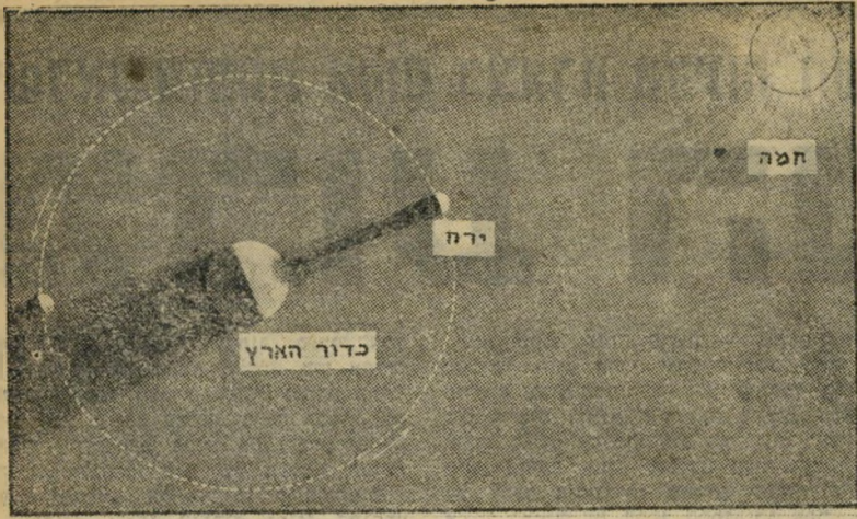
ליקוי חמה — הירח מסתיר חלקית את השמש רק כשהשלישיה בקו ישר