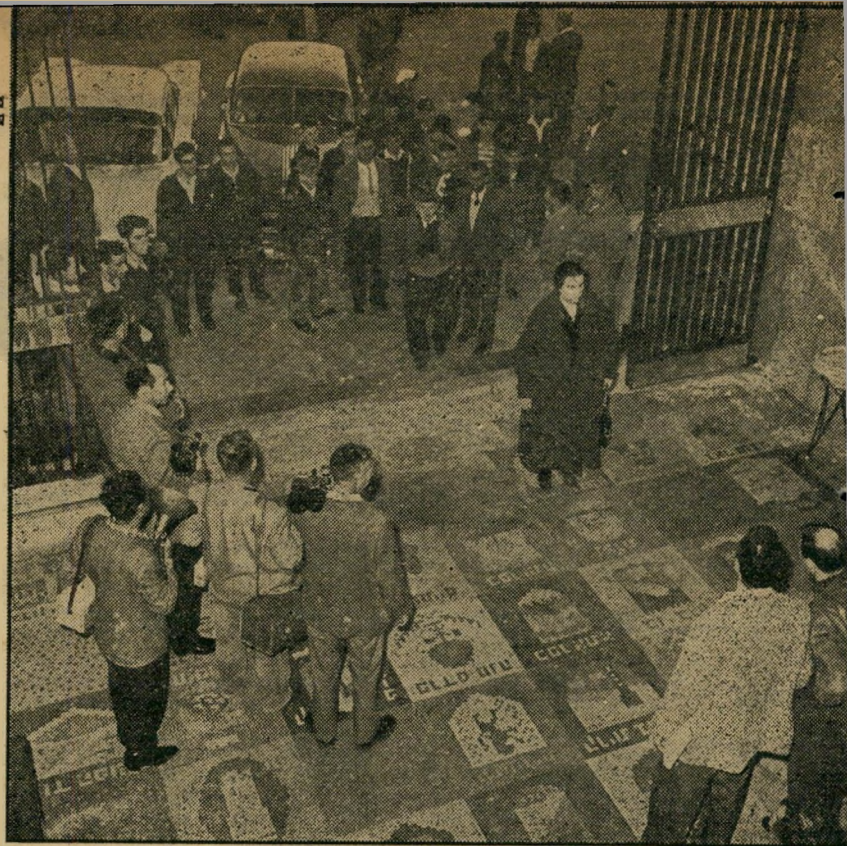
גולדה מאיר (בכניסה לשיבת מרכז מפא"י) אמיצה מכל גבר

אדרבא: מכונני הדיקטטורות של הימין בדור האחרון שפכו קיתונות של לעג על אנשי-הרוח. השיבו על כל טענה של צדק במכה של אגרוף. אמר הרמן גרינג: "כשאני שומע את המילה, תרבות, אני פותח את הניצרה של אקדחיו".