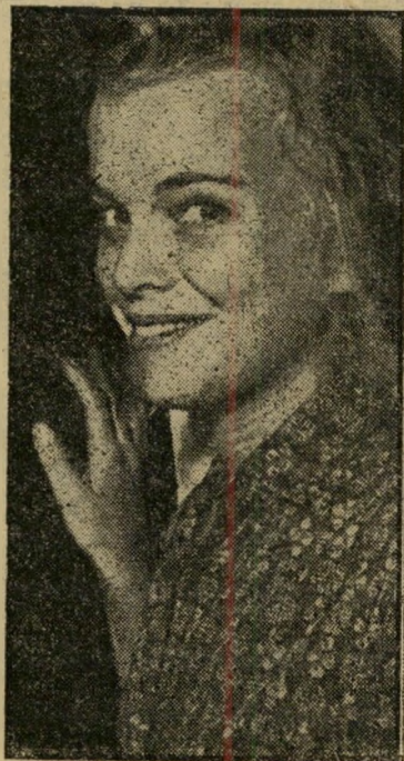
סופרת בלפרדג' הידיד אינו סדיי-בו

חמיה-שיחרור עצמם על המצב החדש ש-נתהוה? דו"ח מעניין על כך נכתב בידי ז'אן דניאל, הסופר-הכוכב הצעיר ויפה התואר של ל'אנספרס, יהודי יליד אלג'יריה. כתב דניאל, כמאמר בשבועונו: האזנתי לשידור תצאות מישראל-העם באחד הבתים הצעירים והקודרים של הקאסבה באלג'יר, בהם נוצרת עתה ההיסטוריה של המהפכה האלג'ירית, אחרי שהייתה נושא חביב על כותבי ספריה-פועי. ישבו, עשרה איש, על מחצלות סביב שולחן גמור. השעה היתה סמוכה להתחלת העוצר. כיתות החיילים הקולוניאליים טרם תפסו את ה-גגות, כדי לסקוח על הנשים שנתנו, בלילה שעבר, את הקצב לשיירים הלאומניים. על השולחן היה פרוש דגל-משי של הפל"ן. בקאסבה של אלג'יריה, שנטרקה ו-הותקפה אלפי פעמים, בילו צעירים אלה את הערב כאילו היו מתונים. כיצד