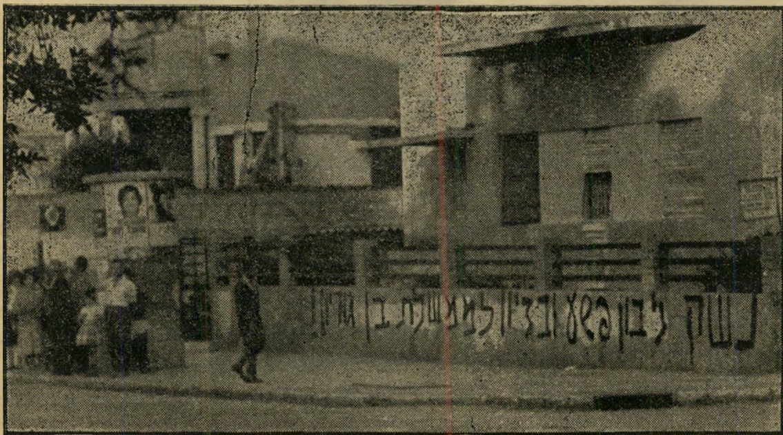
פיסמה זו עדיין נשארה על גדר הבית בשררות ירושלים ביפו, ליד בית החולים דג'אני, מהימים בהם כמעט גרמה עיסקת מכירת-חנשק לממשלת בון למשבר ממשלתי חמור. אבל מה אשם בזה פנחס לבון?