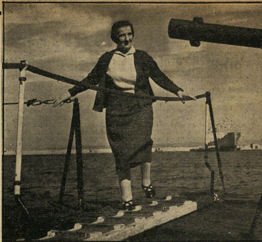
אומקירב למופת: גולדה מאיר מוז תותחי ביגיי

שדות הכותנה, שהיו פעם גאות המדינה, נתונים בסכנה. ספק אם אפשר יהיה לורוע את כולת-ההר, שהתקבלה יפה בשנים הי