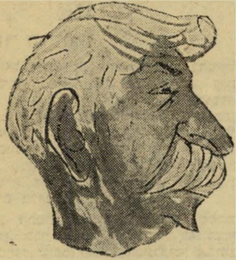
יחיאל דהבני בקונגרס ה־25

יש פה ענין כזה, שיש צירים שלמים ויש חצאי־צירים. הציר מקבל נורא יחס, והחצאי־ציר או הסגן־ציר, רק חצי יחס. לי משלו אוזניות. הציר השלם מקבל אוזניות והסגן־ציר — לא מקבל. ככה זה גם עם תיק ציר, שהוא לא מקבל, ואינפורמציה נותנים לו רק חצי, ועוד כל מיני דברים בלתי חשובים. לפעמים הם בסדר, אבל לפעם מים הם לא מסכימים, ודורשים אוזניות, הריקים ואת כל האינפורמציה. אז מה אני יכולה לעשות? רק להסביר ולהסביר ולהסביר להם ציונות.