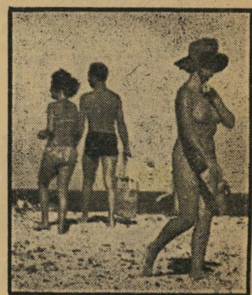
החוף הנודיסטי בכפרטרוז

כשהיינו שני צעירים ישראליים, בסך טרופז אשר בדרום צרפת, נילה מישהו את אונינו שבמרחק ארבעה קילומטרים מן העיירה נמצא חוף נודיסטי הקרוי „חוף סאהיטי“. נסענו לשם. תחילה ראינו רק אנשים בבגדיים, כולל אשה הרה בביקיני.