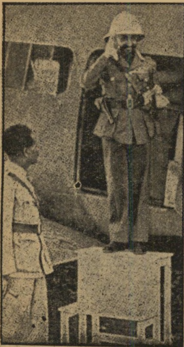
היילה סלאסיה עוזו ושותף ללא סוף

אך במקום שם שולט הקיסר, שלטוני מלא ובלעדי. החלטתם הזעירה ביותר של סקידיו טעונה הסכמתו האישית — ועל ה-פקיד הנזון לבוא אליו אישית, להתכופף בשער הארמון, להתקדם בכפיפה וליפול לרגליו. מפיר מרותו וזוכים במקרה הטוב ביותר לתלייה פומבית ברחוב. במקרים חמורים יותר, כגון הפגנת עובדים למען שיפור השכר, נכלאים הפושעים בכיכר ראשית ב-כלוב של זכוכית, יחד עם נמלים אדומות, האוכלות אותם בעודם חיים. משטר זה היה נוח לקיסר בן ה-69, הוא,