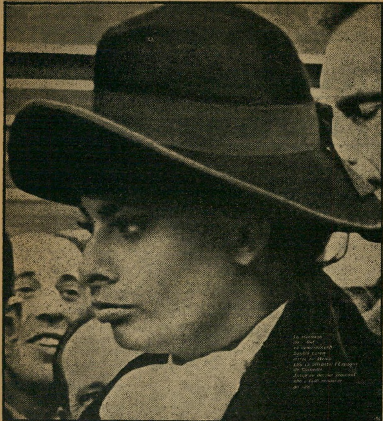
סופה לורן בספרד אין תקווה לטוריאדורים

רוצה שאני אופיע בסרט שלו, בתור ספר-דיה. דחיתי את ההצעה ובמקומי תופיע מלכת הסטריפטיו. כשנסעתי לניס, רדף אחריי אי עד לשם. אני כבר מכירה אותו חודש ואף פעם לא באתי אליו עם אותה התלבושת. אנכי, הוא מדבר אידיש, פעם כתבתי משוה בעברית והוא התחיל לקרוא מה שכתבתי. רע אבל קרא . . . שמועון ישראלי נוסע עכשיו אפילו בסתם יום של חול במכונת חדשה, פורד 1961. אותה רכש לאחורונה. אולם נקמת המכונות על מה שעושה להן שמועון בתוכניתו האחרונה לא איחרה לבוא. ביום הראשון בו נהג שמועון במכונתו החדשה, נקלע להתנגשות ומכונתו נמעה מפנים ומאחור . . . אגב, באחת מהצגותיו האחרונות של שמועון, ישב הקהל התמה במשך 45 דקות ההספקה וחייכה שתעבור התקלה הטכנית עליה הודיע השחקן עם תום ההספקה הרגילה. התקלה נגרמה משום שהפסנתרן המלחה את שמועון נעלם לפתע. התברר ששם החילת התוכנית יצא לנוח מאחורי הקלעים ונכנס לתוך תיבת הקונטראבס. מאחר והרעש הגדול הפריע לו, סגר על עצמו את המכסה ונרדם . . . עכשיו הגיע גם תורם של הספרדים להשתגע מסופיה לורן. הצינו לה תפקיד בסרט גדול שיוסרט בספרד על סיד, הגיבור הספרדי האגדי שנלחם נגד המאורים. סופיה דחתה את התפקיד הנשי בסרט, משום שסברה תחילה שלא תוכל לבצע אותו כראוי. לבסוף שכנעו אותה. בין סצנה לסצנה מבקרת כושיה בויורת מלחמת-השחרים, והטוריאדורים המקומיים מתחרים לים לקנא בה. הקהל מריע לה יותר מלהם.