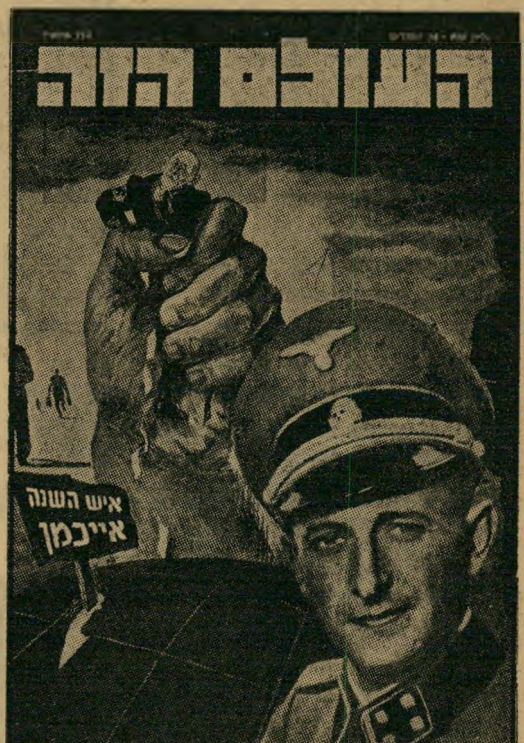
איש השנה תש"ד — הצלת רבבות

• אך לא מעיני ההנהגה הציונית בארץ-ישראל, שקיבלה מקאסטר וברננד דריחים רצופים על התקדמות השואה.