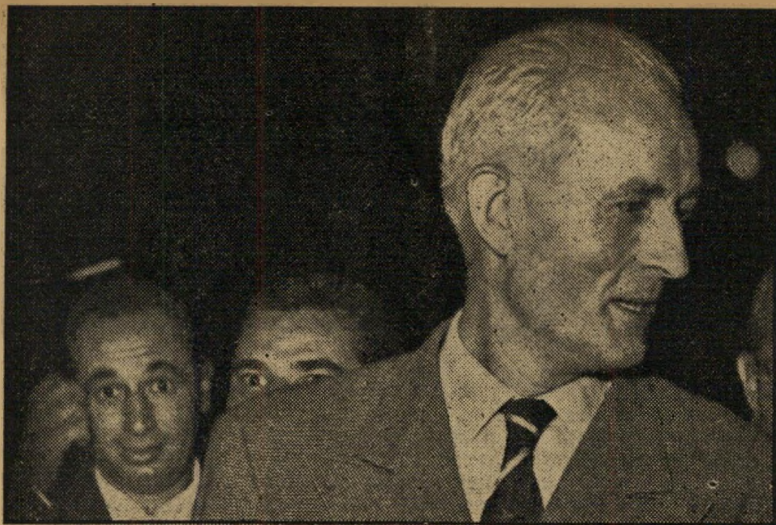
פיאר זיילבר ושמעון פרס התרופה: הפיכה צבאית

מי עומד מאחורי גילוי פאשיסטי זה? קובע לאסטפרס: הפעילים באו ברובם מתור-גי האומה הצעירה, התנועה הפאשיסטית והאנטישמית הרשמית של צרפת, שסמלה הוא חיקוי לצלב-הקרוס. הם נטשו תנועה