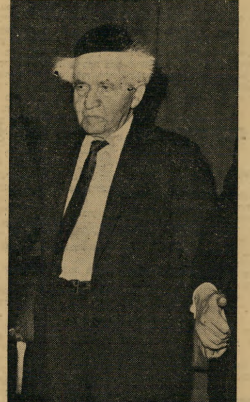
שר הדתות: הבטחון הוא אלוהים

מה קרה? שנתיים לפני קום המדינה נטל דוד בן-גוריון לידיו את תיק הבטחון של הממשלה-בדרך. הוא הפך את ה"בטחון" לאחוזתו הפרטית. אחרי שהשמיץ משך דור שלם את המיליטריזם של ז'בוטינסקי, הפך בן-גוריון למיליטריסט קיצוני עוד יותר ממתנגדו. באמצעות "הבטחון" השתלט בן-גוריון על מפלגתו ועל המדינה. הוא למד מארכימדרס הי