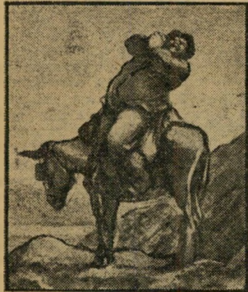
דומייה: מאנצ'ו פאנפה