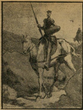
דומייה: דון קישוט

מאונך: 1) רבינסן. 2) מסולם הצלילים. 3) כינוי לנכונה ולסימור כוב. 5) ניל נהר. 6) פרט בחווה או בכרית.