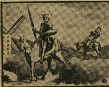
דון גוריון ומאנצ'ו פרם

בו הכתמים הלכנים בעתונכם, עד היעלמו כליל. ש. קוניצ'פולסקי, משק יגור