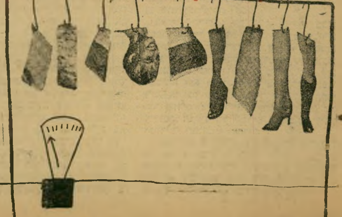
שלח לנו את התדקנה שלו לתחרות החתירות באיחור