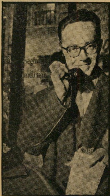
אנטי-שמיו הוריה אובידיוס ופרעות ביהודים

הסופר הרומני נמנה, בזמן המלחמה, עם אנשי "משמר הברזל" הפאשיסטי, ארגון שערך פרעות ביהודים והטיל מורא על מת-