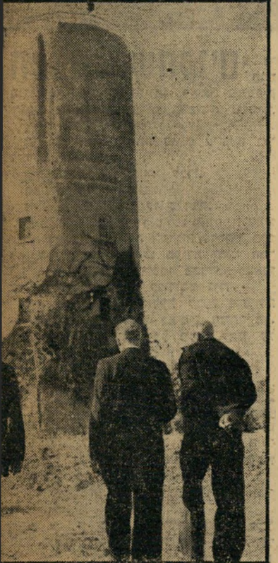
יקום שבשרון, מסייר ראש-העיר המדומה ב" חברת אחד מחברי הקיבוץ ושומר ראשו.