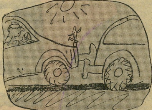
זה מה שהמשטרה לא הספיקה לראות

כשנגמרה מחצית השעה, שילמתי ארבע וחצי לירות. סתם כסף מיותר. התחלתי לחשוב, כיצד להציל את הכסף הזה, ואמרתי לעצמי שאם אני מפסיק עכשיו, אחרי השיעור הראשון, אני מפסיד ארבע וחצי לירות נקיות. אבל אם