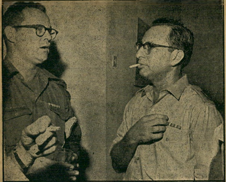
צ'רה ולסקוב, ההצגה נדחתה