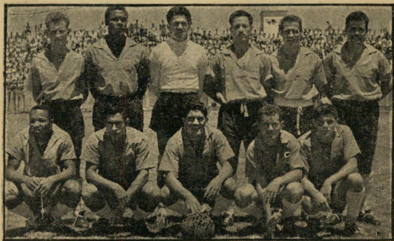
נבחרת קוסטה-ריקה ההצגה הוקדמה

חימאנו, הנער הספרדי גבה-הקומה, היה השחקן האחרון שהותם על ידי קרמר