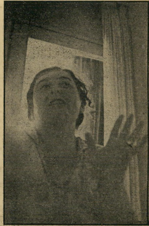
אשה-מזמרה לבקוביץ תמורת 5000 ל"י

מאז לא סיפרתי את הדבר לאיש. לפני כחודש פניתי לטוביה פרידמן, מן המכון לדוקומנטאציה. ספרתי לו את המ' אורע. פרידמן ענה לי שאפילו אם נכון הדבר לא אועיל בזה מאומה. אינני יודע אם הוא צדק או לא. עתה, כאשר הועלתה ב' העולם הזה הסברה שהיטלר חי, מצאתי לנכון לפרסם את הדבר.