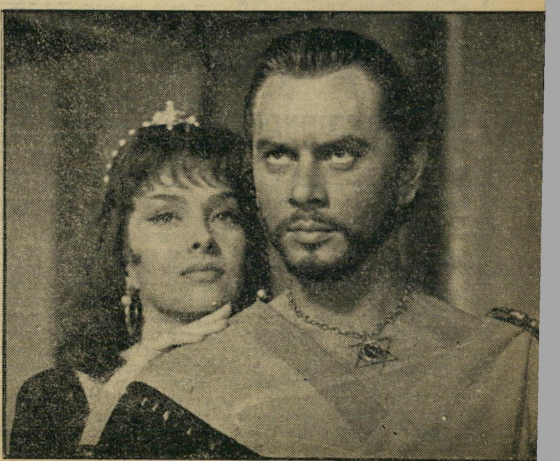
3. שלמה ומלכת שבא (ארצות-הברית)