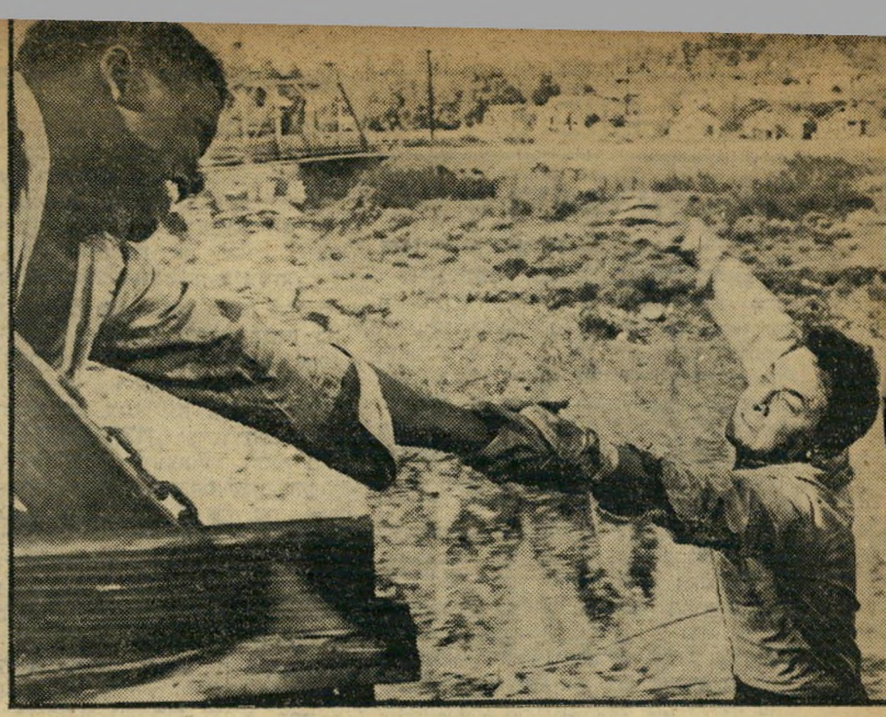
3. הנועזים (ארצות-הברית)