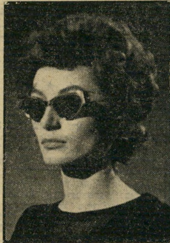
שחקנית משנה השנה אנוק אימה החיים המתוקים

ס הרחבים את מקומן של הסיפורות, התיישרו והמוסיקה גם יחד. זהו גם אמצעי קשר הטוב ביותר אל העולם הרחב ואל אנשים החיים בו. אם מסקנות אלה יפות לגבי כל צופה קולנועי, על אחת כמה וכמה טובות הן לגבי צופה הישראלי, העומד בראש רשימת הקקים למזון רוחני זה, שהוא במילותיו לראשיהממשלה, הצופה, "הסינימא" ביו בעולם.