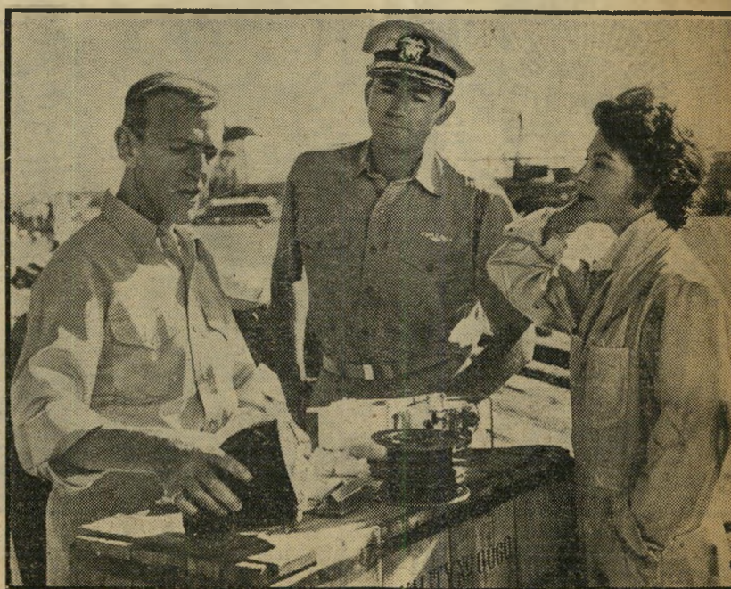
1. על החוף [ארצות-הברית]