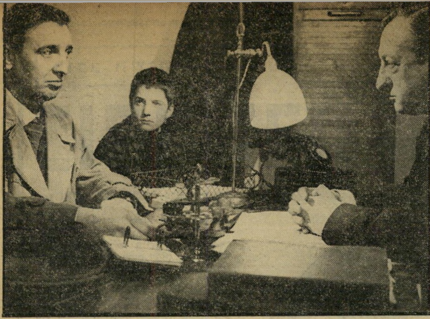
2. 400 המלקות [צרפת]