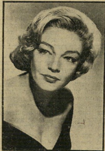
שחקנית השנה סימון סניורה מקום בצמרת

בתחילת העשור השביעי של המאה אין עוד ספק כי הקולנוע על שלוחותיו השונות, כולל הטלביזיה, הוא ספק המזון הרוחני הגדול ביותר של מירב האנושות. שוב אין זה אמצעי בידור ושעשוע בלבד, זהו מכ' שיר שבכוהו להשפיע על השקפת-עולמם, לעצב את דעותיהם, לקבוע את טעמם האס' תטי והאמנותי ואת התנהגותם החברתית, לכחן את שאיפותיהם לעתיד ולשנות את מושגיהם. זהו מדיום שתפש בקרב ההמו'