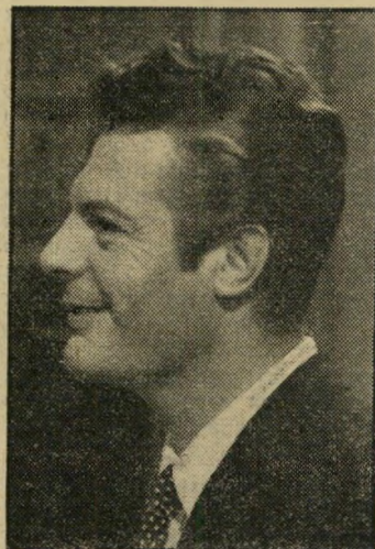
שחקן השנה מרצילו מסטרויאני החיים המתוקים

וליוני מורים של צ'ולויד רצו ה' שנה במסיונות ההקרנה של בתי-הקול' בישראל, כ-400 מוצרים של תעשיית לנוע היצעו השנה למכירה לצופה ה' אלי הברוך. מאות מחות בכל חלקי מומחים תסריטאים, במאים, סופרים מ'ם, חיפשו את הדרך אל כיסו. הם נו בפניו אלפי פרצופים חדשים, עשרות ית רעננים, אינסוף של רעיונות מקור' הם ניסו לגרות את יצריו ואת האינ' ש שלי לפרוט על מיתרי רגשותיו או ום במקבת במוחו.