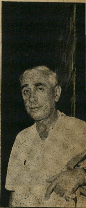
לבון מי אירגן את הקנוניה?