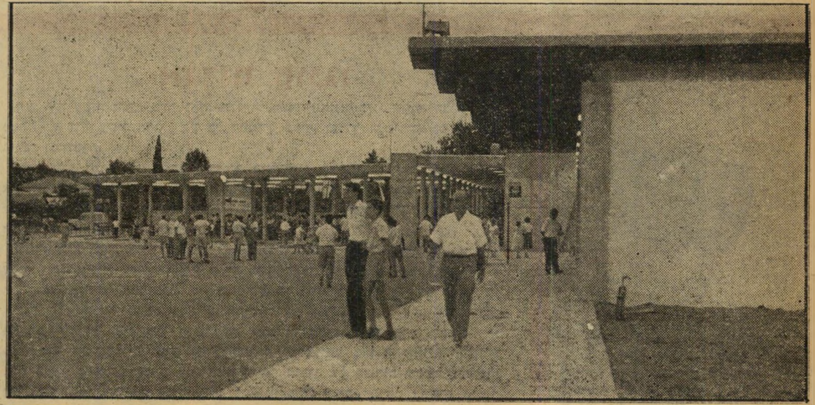
מראה כללי של התחנה החדשה בכפר-סבא, ערב חנוכתה