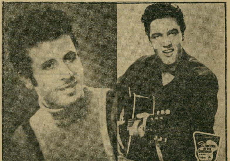
כרטיס הביקור של פרסלי-כהן אלביט מת, יחי אפריים!

הסיבה: הפועל המזרחי ניסה לזכות, לא- חר כיבוש השלטון, באותם היתרונות שלא