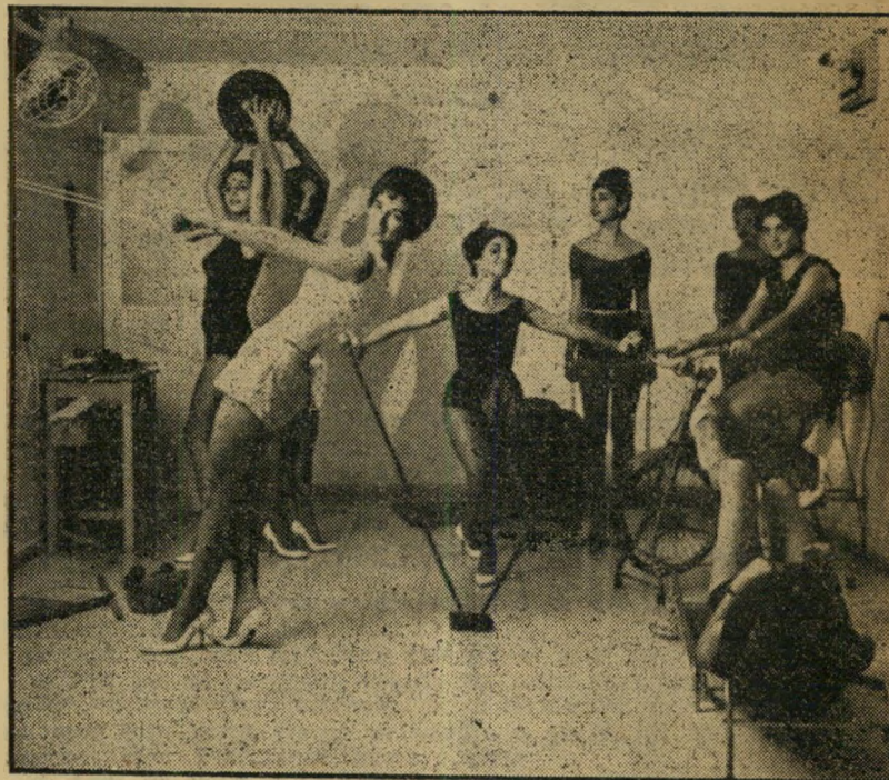
שעור בהתעמלות מלווה בשימוש במכשירים חדישים, שכל אחד מסתמטואם לאפשר הפגלתו של חלק שונה בגוף. נותן לו את הטיפול המתאים: אופניים, קפיצים, כדור-כוח ומסות להפעלת שרירי החזה.

יש גם בעיות אחרות. אשה אחת למשל, ביקשה מהאולפן אישור שיעיד כי הכתמים הכתולים שעל גופה נגרמו על-ידי מכונות ההרזיה ושמקורן אינו בטיפול מסוג אחר.