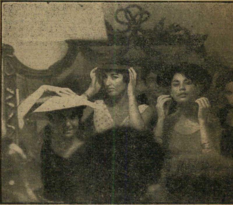
שעור ב"שיק" הוא אחד השיעורים הקשים ביותר. זהו דבר שנוגדים עמו — או בעדיו. לשכתן של הצבריות, שרובן חסרות שיק, יאמר שהן עושות מאמץ לרכוש תכונה נדירה זו. בצילום: כיצד מופיעים בכובע.