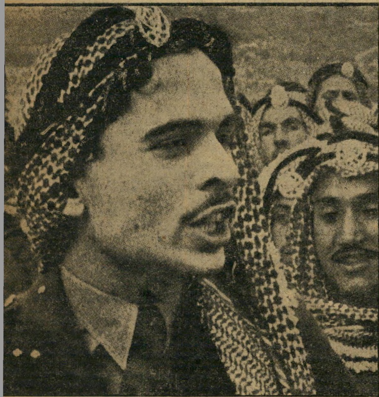
המלך חוסיין ונאמניו הא הצטננה לו חברת ביטוח

יש אדם אחד בעולם, ששום חברת ביטוח לא היתה מקבלת אותו לקלח רצוי. כי אילו נערך מישאל מיהו ה' המחזיק בתפקיד המסוכן ביותר בעולם, היה אותו אדם נבחר פה-אחר. הפקידו יותר מסוכן מזה של טייסה-חלל העתידים ואף מסוכן מתפקידו של חייל אוי'ם בקונגו וזה חוסיין, מלך ירדן.