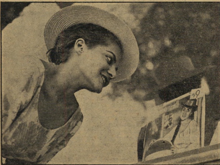
זמרת פורת ליד תקליט של עצמה

סוליבן לא רגז. הוא ציחה לכתוב לזמרת הצעירה כי הוא מצטער על שאינה יכולה לצאת לארצות-הברית, להופיע בתכניתו, הסכים לשתתף בתכנית זו בכל עת