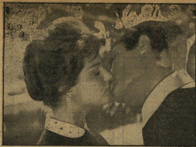
מאסטרויאני וקארדינלה ב"אנטונו היפה" האהבה היתה מחלה

מוסברת בכך שבילדותו למד את יחסי המין לראשונה בבית'בושת, נתקף בחילה ומאז לא היה מסוגל לביא במגע עם אשה שלה רחש אהבה גם התנהגותה של אשתו אינה ברורה לחלוטין. הצופה אינו מבין אם נטשה אותו בגלל מומו, בשל חישובים מסחריים או משום שלא אהבה אותו.