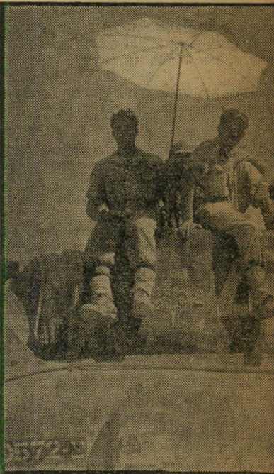
טאנק לוקסוס התקינו לעצמם שני טאנקיסטים אלה, על-ידי הצבת שמשיה מעל לצריח.

בשעת התקפה מרוכזת של טאנקים על יעד המחזק בי הפיקוד, ממנו מתנשאות האנטינות של מכשירי הקשר, הטאנקים התוקפים, כשהם פרושים בדומה למניפה ענקי