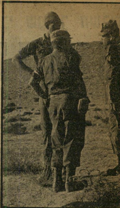
יונה וחצי הוא הקיצוני מש מאל, המיתמר מעל לקצינים הגבוהים יותר ממנו — בדגה.

ב עיני הפיקוד הגבוה של צה"ל קיימת הנחה יסודית אחת: במערך הצבאי של רע"ם חל שינוי גדול. ראשית — בגלל הזרימה הגדולה של נשק סובייטי, ב" עיקר שריון ונשק ארטילרי. שנית — מפני שהסובייטים והמצרים הגיעו למסקנה שאין טעם בעיסקה מסחרית פשוטה, שיש לאמן, לעומת זאת את הצבא הערבי בשימוש בנשק המוגש. מזה למעלה משלוש שנים קיימת רכבת