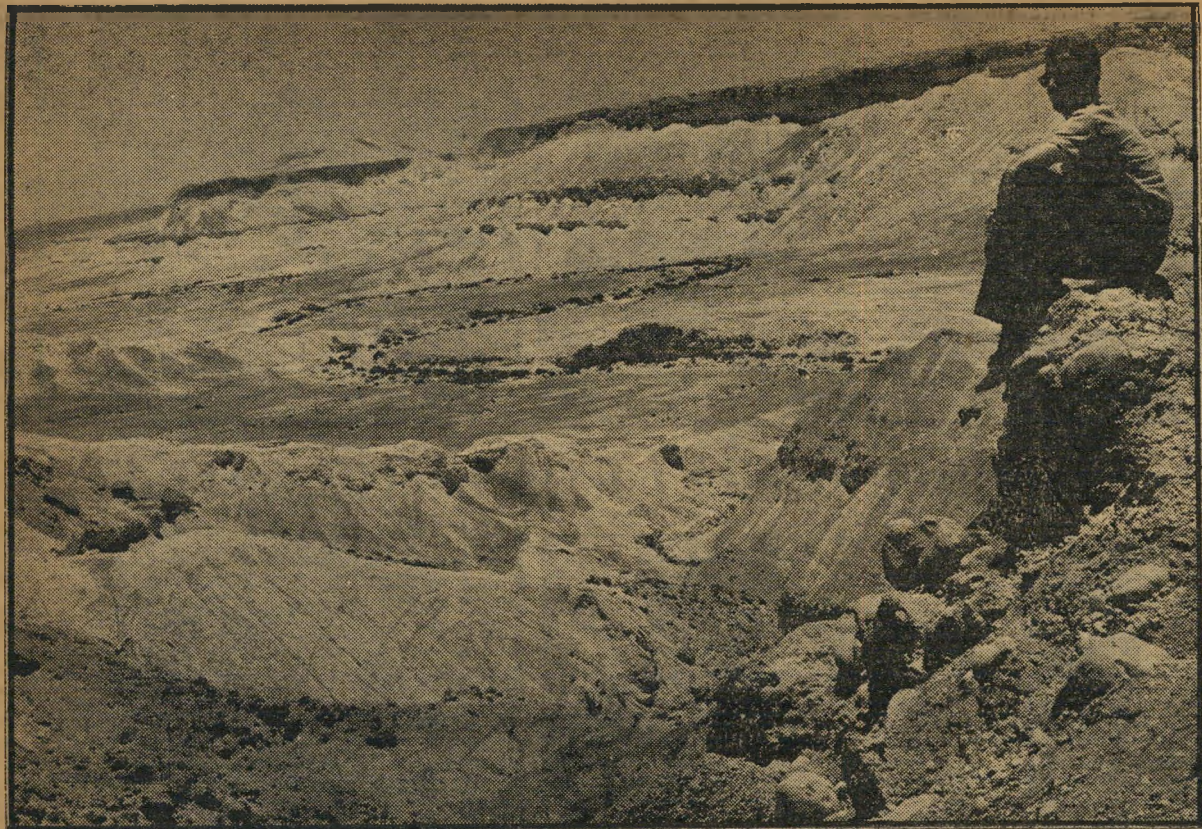
המקום המיועד לאחוזת קבר בנגוריון אחרי הפיראמיות, האנבאלידים והמקדש של פראנקו —

סיקון שלהם, אולי מתוך מחשבה שהפעם לא ימצא מי שירצה לחקות מעשים אלה, כיון שנעשה עלידי כושים. רק עליהם נשאר נאמן למסר ה' עתונאי הישראלי. היומון המפמי מסר לקוראיו כי „החילים הקונגואיים חללו את כבודן של נשים לבנות.“