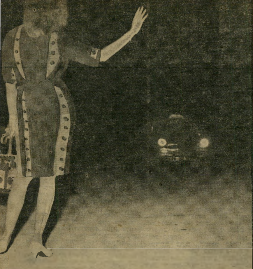
על עבירה דומה. מיבחר מקרי, תיקים של השנה האחרונה בלבד, 15.3.59, בשעה שלוש לן

הוא היה שיכור. ניסתי לנשק אותי והרי-נשתי ריח; וזה גרם לי הרגשה לא טובה בבטן וסחרחורת. אמרתי לו "עזוב!" הוא נסע לצד. היה קיר לבן, שהיום אני יודעת