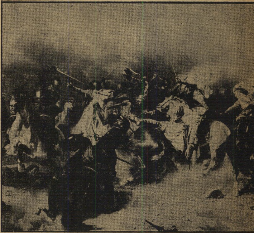
1632 שיאה של מלחמת-שלושים-השנה: מותו של מלך שבדיה, גוסטאב אדולף, בקרב ליד העיר הגרמנית ליצן. בתמונה: המלך קז'ימיר, שרכב בטעות לתוך שורות-האויבי, ניפצע סכדור, נהרג בחרבות. המלחמה הסתיימה למעשה בתיקו.

מדוע עדה בידי הלאיוצלים לכבוש בקלות כזאת את אחת מאומות-התרבות המפותחות ביותר בעולם? כיצד יכול היה איש כמו אדולף היסלר ליהפך למנהיגם הנערץ של שמונים מיליון גרמנים? כיצד יכול היה עםם של קאנט וגיתה, לוטר ובאך להיכנע ללא קרב לטיפוסים מסוגו של אדולף אייכמן? בין כל הסיבות הרבות מזוקרת תשובה אחת, המתבקשת כמעט מאליה: הלאיוצלים השתלטו על גרמניה מפני שגרמניה עצמה הייתה לאיוצלח קולקטיבי. כאשר אדולף היסלר, הלאיוצלח המונומנטאלי, פתח את פיו — הוא עורר הד אוטומאטי בלבה של אומה שיכלה כולה להזדהות, בתה-הכרתה, עם דמותו של איש זה. הנאציזם, כמחלת-רוח קולקטיבית, יכול להשתלט על כל אומה, כאשר מזדמנות יחד הנסיבות הפוליטיות, הכלכליות והחברתיות המתאימות. אולם בצורתו המיוחדת, ההיסלרית, התאים הנאציזם במיוחד לנשמה הגרמנית. יתכן כי גרמניה לא תהיה המדינה הנאצית האחר