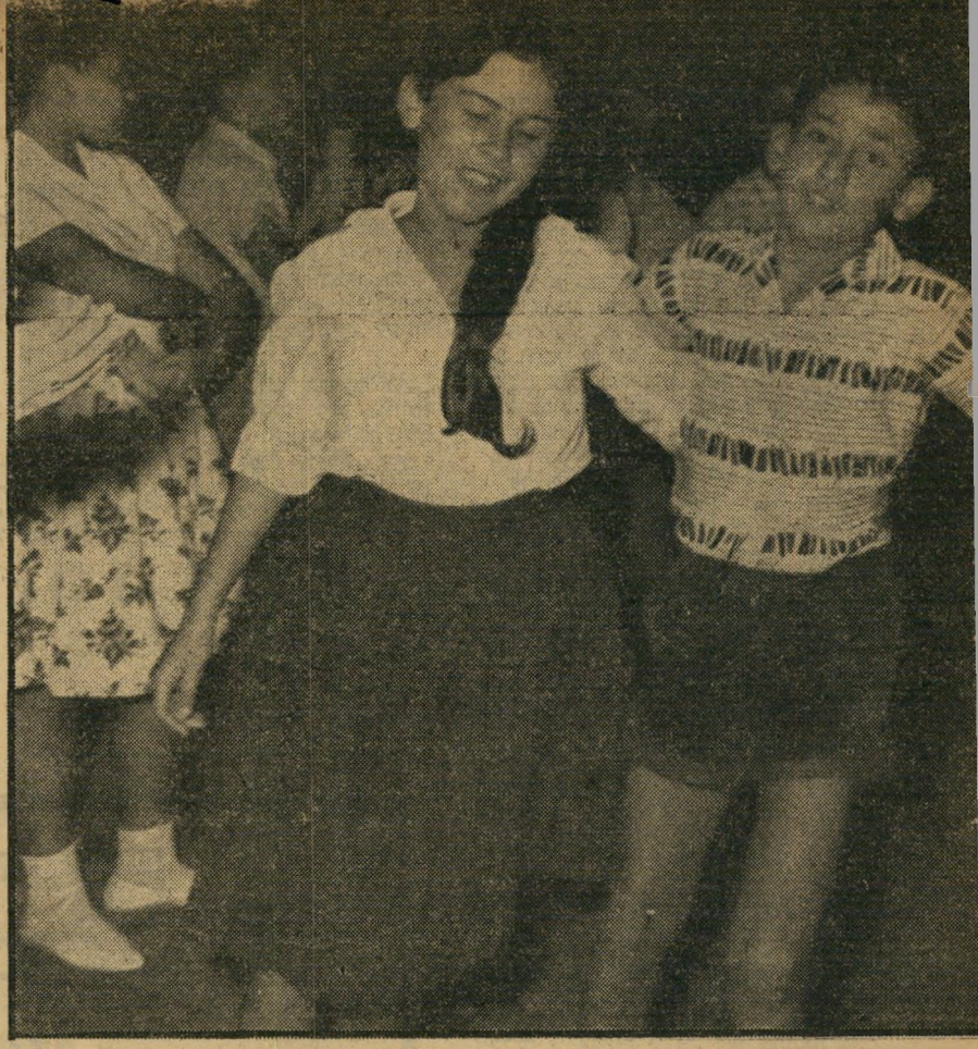
זה מתחיל רקוד מעגל תמים של תלמידי כתי ז' בבית-הספר תל-נוער, הנערך כמעט מדי ליל שבת בככר-דיזנגוף. הם בני 12, ותחילת הקשרים בין בני-הזוג בגיל זה. בארצות הברית זוהי תופעה מקובלת. בארץ מתפשטת החברות רק כעבור שנתיים, בגיל 14.

מסתבר שקיים קשר הדוק בין דמייהכיס לגיל. בעוד שעד גיל 15 דמייהכיס המקובלים (המשך בעמוד 16)