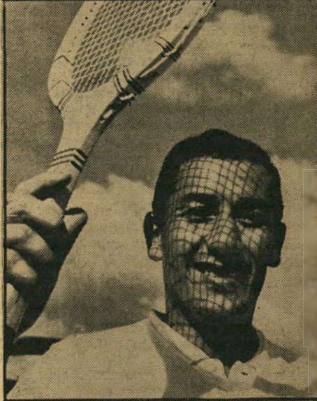
טניסאי איילה מנוצה מול מנוצה= מנוצה