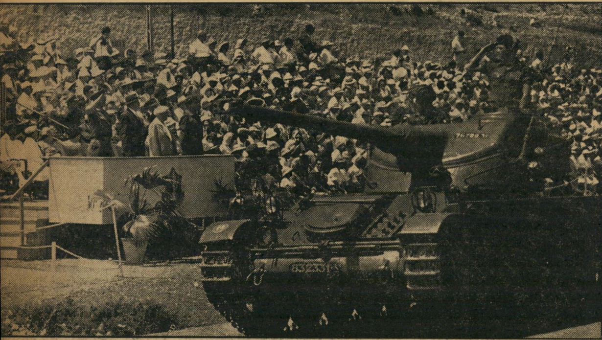
אלוף פקוד הצפון מאיר זורע, ראש הממשלה, דויד בן גוריון, נשיא המדינה, יצחק בן צבי והרמטכ"ל חיים לסקוב. מאחוריהם יושבות רעיותיהם ורעיית נשיא המדינה הראשון, וורה היצמן.

העיר כולה הפכה ליריד ענק. כאילו כל מי שהיתה לו עגלת תינוק וכסף לקנות