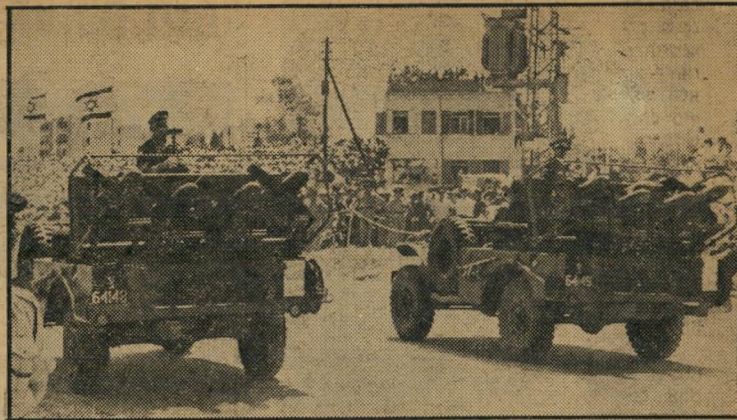
הטילים טילים מודרכים אנטי-טנקיים מטיפוס ט.ס. 10, שאפשר לשנות את מסלול מעופם באוויר, מורכבים על גבי קומאנדקרים, היו אחד החידושים של מצעד צה"ל השנה.