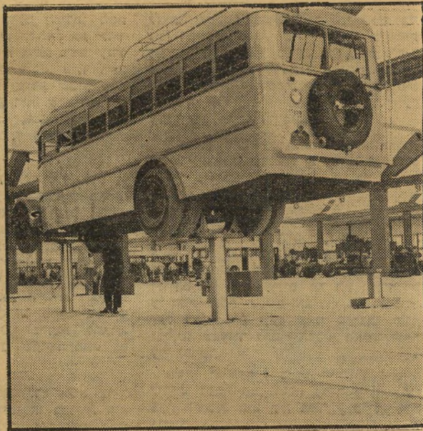
אחד מהמנופים במוסך החדש — בפעולה. מראה כלרי שר מישקעי התיקון במוסך.