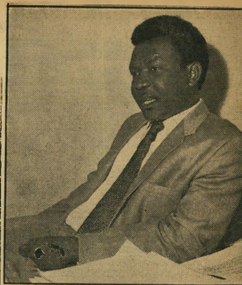
זה פוגש! קובע הסכמי השני של שני רות גאנה, לשמוע כי קוראים לך "כוש".

על כל פנים, באופן תהיכרתי, הם מפני נים כלפי האפריקאי את אותו יחס שהם עצמם סבלו ממנו באירופה. המשיך הדיפלומט הצעיר: "כאשר צעקו כלפיהם שהיודים, לא המילה היא שהרגיזה אותם. שהרי באמת הם בני העם היהודי. הרגיזה אותם הנימה, האימפליקציות, שמא חורי המלה יהודים. אותו הדבר קיים לגבינו!"