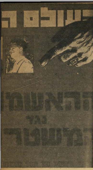
שער העולם הזה 53 בינואר 1956 — שפ במערכה הגדולה על המשטרה, זכה בנצחון גמ