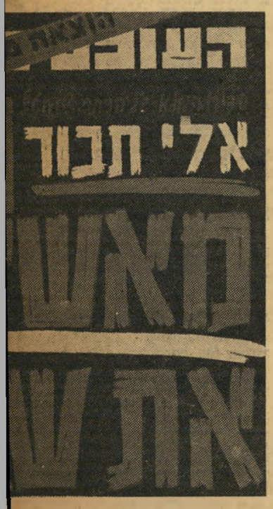
נרסה זוכה צי 7

למחרת היום הרדעתי לו באדיבות שאין אנו יכולים לקבל את הצעתו, וכי אנו מקווים שהדבר לא יפגע ביחסים בין שני העיתונים. התשובה שלו באה כעבור כמה חודשים, בצורת שני מאמרים ארסיים, בהם האשים אותנו בכל הפשעים, מפורנוגרפיה ועד לרמאות. ענינו לו בהתאפקות, אך לא יכולנו לשים קץ למלחמה. באחד הרגעים הקשים ביותר של קיומנו, בשיא המערכה על חשבוטאן, כאשר הוטמנו פצצות במערכת ובדפוס שלנו, שאחת מהן פצעה פועל, נעץ קרליבך את הסכין בגבנו. הוא טען, לא פחות ולא יותר, וללא נסיון קל שבקלים להוכיח זאת, כי טמנו בעצמנו את הפצצות אשר רק במקרה לא גרמו לאבידות בנפש. כל אנשי מנגנון-החושך ומשטרה-המחור לו כפיים. הפעם לא התאפקנו, והתל דרשיה שלא היה מן הנעצמים.