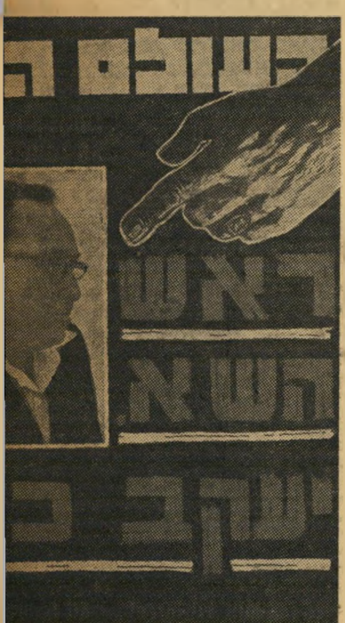
אולי הסקופ גדול ביותר פורסם אייפנס בעתון בארץ, בנובמבר 57